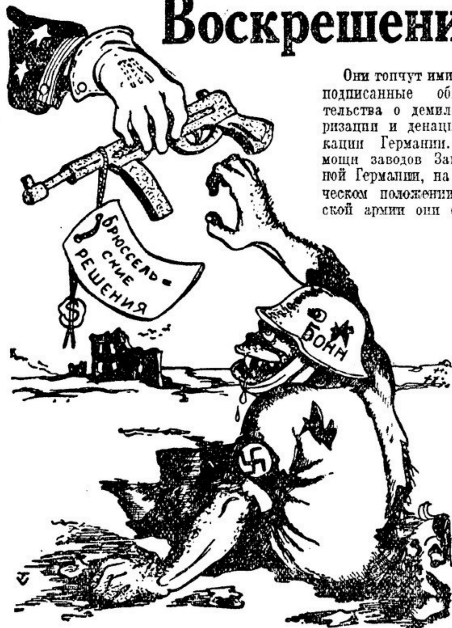
Фашистское чудовище не должно получить оружие! Рисунок из румынской газеты «Флакзор»