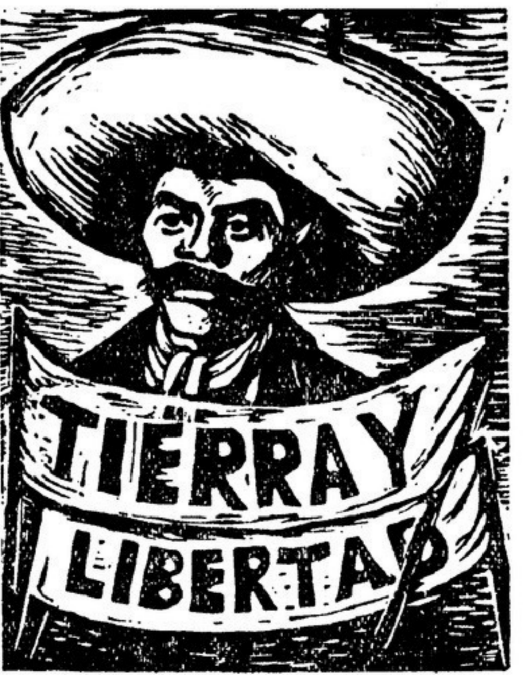
«Земли и свобода» — гравюра мексиканского художника Леопольдо Мендеса

По торговле латиноамериканские помещики и купцы во время минувшей войны, надо сказать, неидурно. Вторая мировая война, которая принесла новые страдания, рост нищеты и колониальной эксплуатации трудящимся Латинской Америки, была временем подлинного «прорывания» для латиноамериканских коммерсантов, которые получали сверхприбыли в